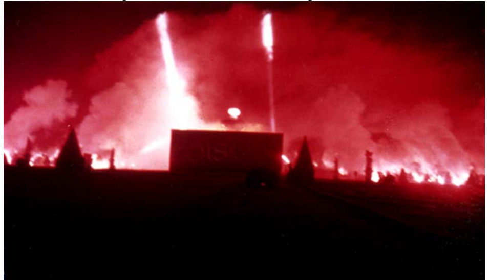
Vaux-le-Vicomte - Un show livré clés en main pour le parfum «Poison».