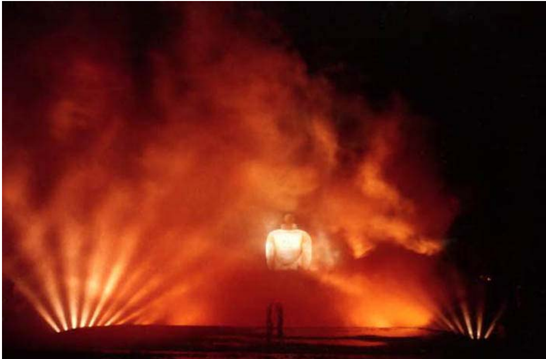
Soirée de conte de fée pour un parfum de rêve: "DUNE"