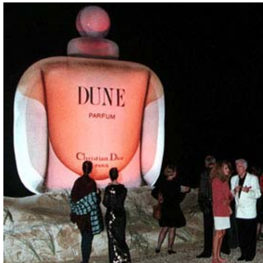
"Dune" a surgi des flots tandis qu'un feu d'artifice embrasait le ciel de Biarritz