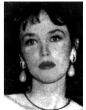
Isabelle Adjani, marraine de charme.